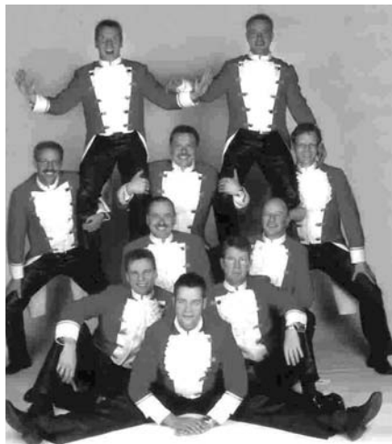
Voiswinkeler Prachtgarde 2006