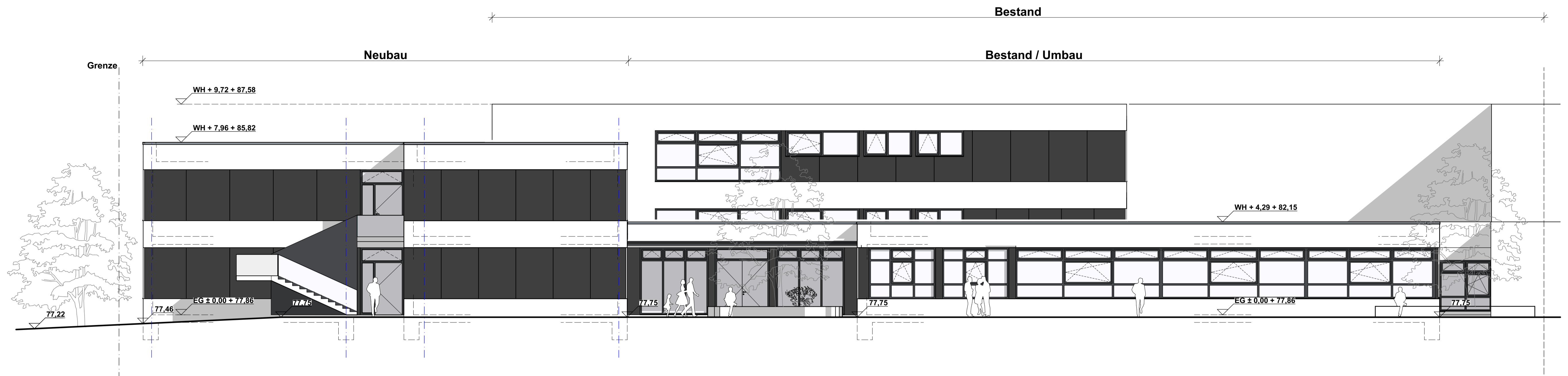
Ansicht - Süd