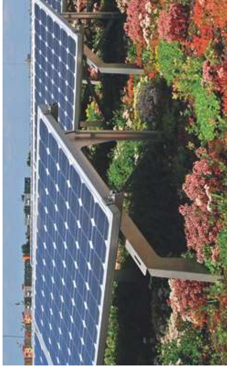
Abb.: Beispiel Photovoltaikanlage