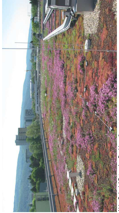
Abb.: Beispiel Extensive Dachbegrünung